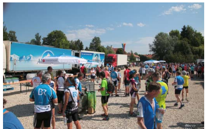
(Mehr Bilder finden Sie in der Galerie auf unserer Homepage)